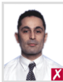
ไกลเกินไป