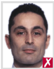
ไกลเกินไป